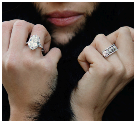
Bague de fiançailles avec diamants latéraux et Secret Heart Boucles d'oreilles The Mark en croix pavée de diamants