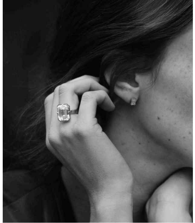
Bague de diamant halo caché, dentelle de diamants