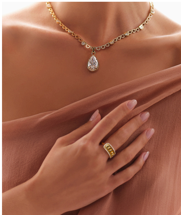
Collier Aura Unbound avec pendentif poire Bague en diamants avec demi-lunes réversibles or et diamants