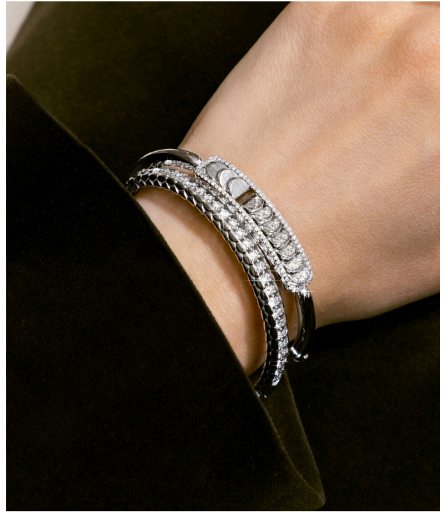
Bracelet jonc Aura Chrome en or blanc, pavé de diamants et demi-lunes Bracelet jonc Arctic Dragon en or écaillés de dragon, pavé de diamants