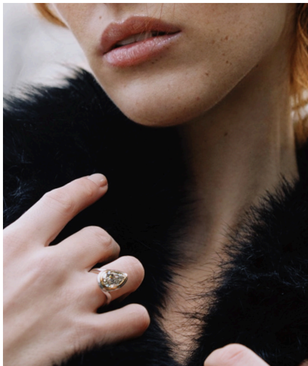
Bague Love-Knot, diamant jaune, serti clos