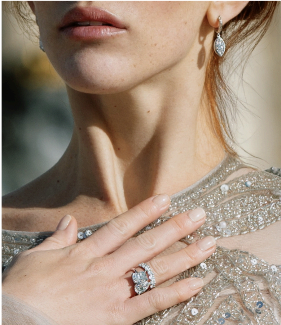
Bague en diamants Toi et Moi taille coussin allongé et poire Bague Sept diamants Coupe Ovale