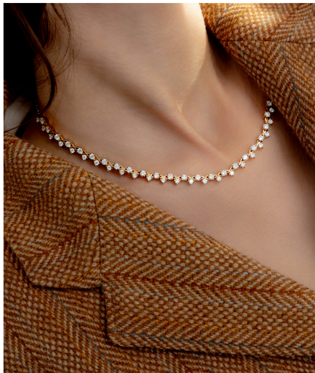
Collier XO rivière de diamants