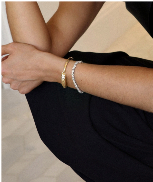
Bracelet jonc Aura en or avec demi-lunes réversibles et contour pavé de diamants Bracelet Tennis Blossom en diamants