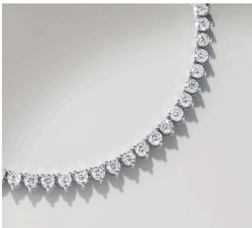
Boucles d'oreilles Starlight doubles, créoles en or pavé griffes partagées et diamants poires Collier Starlight rivière de diamants sertis trois griffes