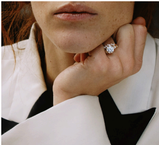
Bague de diamant central serti huit-griffes, dentelle de diamants Alliance profilée, fine dentelle de diamants